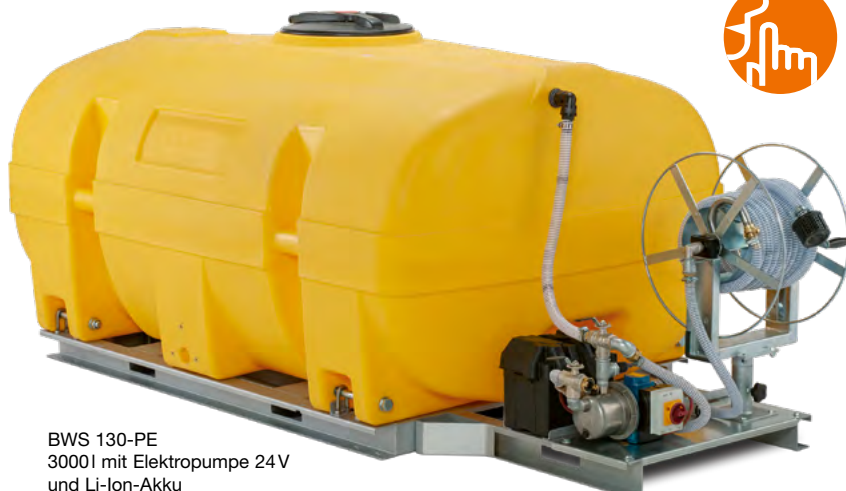
BWS 130-PE 3000l mit Elektropumpe 24V und Li-Ion-Akku